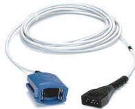
フィンガークリップ