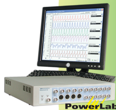
データ収録・解析のゴールドスタンダード

ML846 PowerLab4/26、ML132 バイオアンプ×2、SG-2002ガンツフェルドシステム、マウス用ERG電極×2、針電極、電極台+マンピュレータ、動物用シールドマット、NDフィルター×13、コンピュータ、プリンタ、導入時セットアップ費用