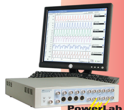
データ収録・解析のゴールドスタンダード

ML866/P PowerLab4/30 ChartPro付、ML132 バイオアンプ、ML117 BPアンプ、ポリエチレンチューブ、BWT-100 体温保持装置、コンピュータ(Windows)